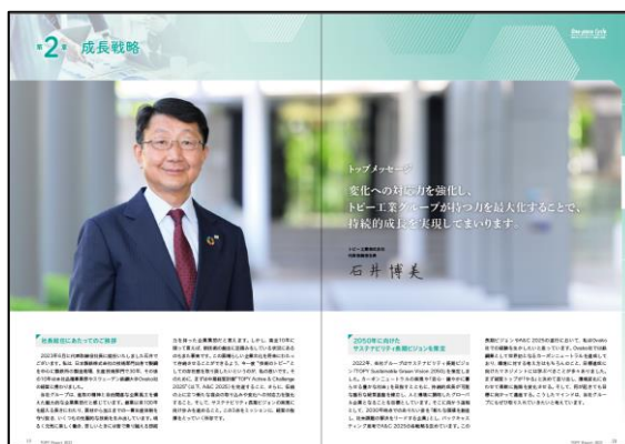
トップメッセージ