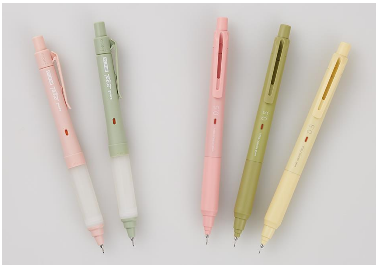
左から『ユニ アルファゲル スイッチ』コットンピンク、オパールグリーン 『クルトガ KS モデル』コーラルピンク、ハーブグリーン、クリームイエロー

今回、「クルトガエンジン」搭載の『ユニ アルファゲル スイッチ』と『クルトガ KS モデル』から、幅広いニーズにお応えできるようラインアップの拡充を目的とした新軸色を発売いたします。それぞれの既存ラインアップに加え、より多くの皆さまの日常に寄り添うことのできる柔らかいカラーを選定いたしました。