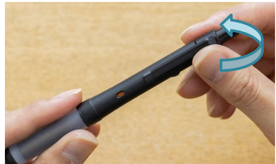
ホールドモード(ロゴがクリップで隠れます)