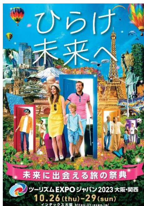
「ツーリズム EXPO ジャパン 2023 大阪・関西」

2023 年は、新型コロナウイルス感染症を乗り越え観光産業が本格的に再始動を始めています。「ツーリズム EXPO ジャパン 2023 大阪・関西」では、本格的に再始動を始めた観光産業を後押しし、2025 年大阪・関西万博やその後の世界から注目を集める大型事業へつなぐ世界最大級の総合観光イベントとして様々な情報発信を行います。