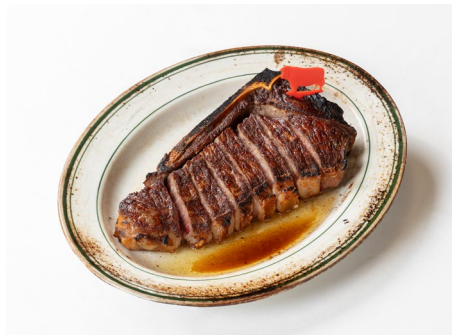
くまもとあか牛 サーロインステーキ 24,200 円