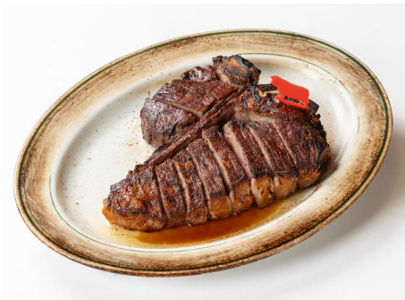
くまもとあか牛 ステーキ・2名様用 39,600 円