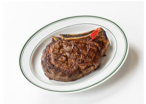
くまもとあか牛 リブアイステーキ 24,200 円