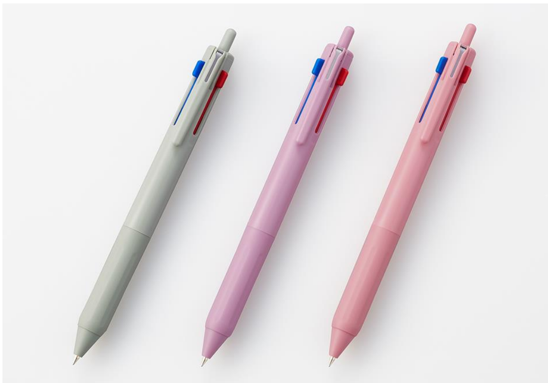
『ジェットストリーム 新3色ボールペン』 左から：グリーンラテ、ライラック、フラミンゴピンク

今回発売する新軸には、落ち着いたトーンでありながら、華やかで気分の上がるオトナカワイイ色味を採用いたしました。日々忙しいお仕事や勉強など幅広いシーンでお使いいただけるラインアップです。