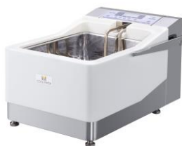
クールフライヤー