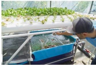
アクアポニックス