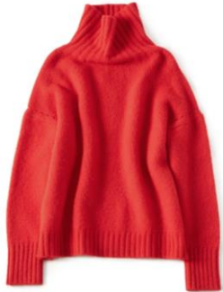
ドロップショルダータートルネックニット ¥42,900