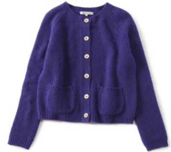
ニットカーディガン ¥42,900