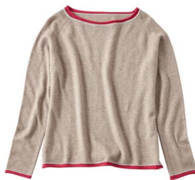
配色ニットプルオーバ ¥33,000