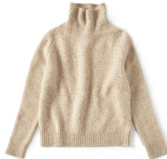
ラグランスリーブハイネックニット ¥39,600