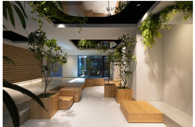
『コスモグラシア両国レジデンス』 エントランス外観/エントランス内部