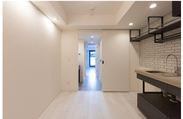
『コスモグラフィア両国レジデンス』住戸内 (バルコニー側から玄関を撮影／玄関側からバルコニーを撮影)