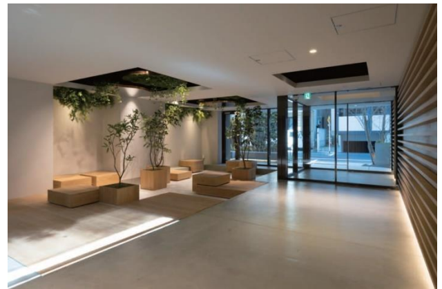
『コスモグラフィア両国レジデンス』エントランス／エントランス内部