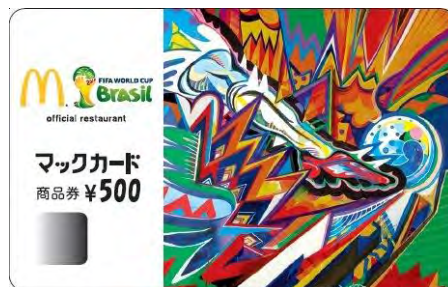
【オリジナルマックカード(デザインはイメージです)】