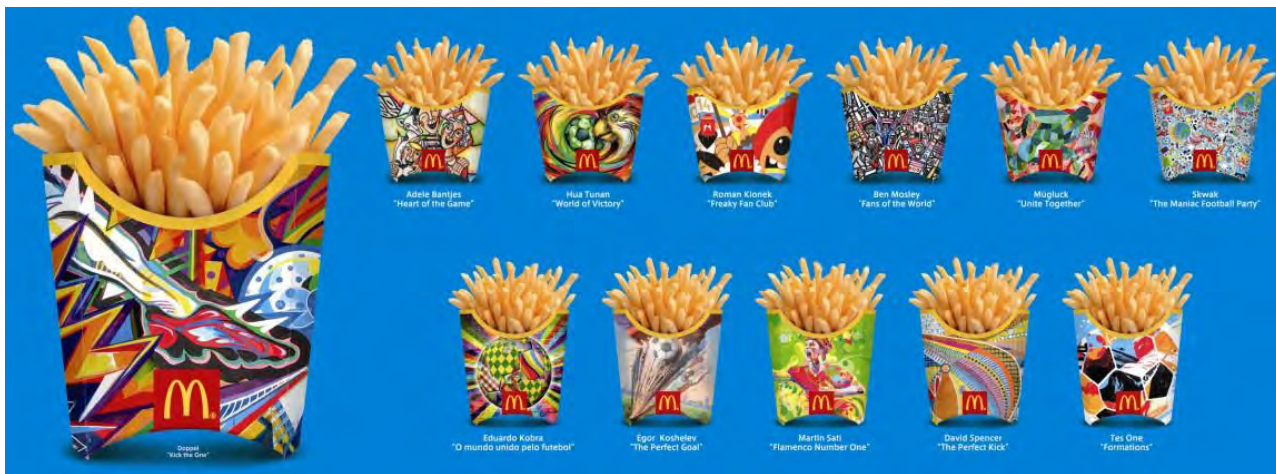
【「マックフライポテト ワールドカップ期間限定スペシャルパッケージ」(全 12 種類)】