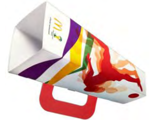
【ハッピーセット「FIFAワールドカップ応援グッズ」(一例)】