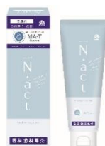
N.act オーラルリムーバルジェル （口腔化粧品） N.act オーラルジェル