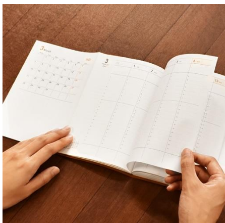
写真) 過去2回の取組みから生まれた「ワンセメ手帳」と「3STEP日記」

2年目：2022年10月6日—2022年12月22日実施。18名6チームが参加。Utopeerチームの考案した「3STEP日記」が最優秀賞を獲得。伊藤手帳が商品化。伊藤手帳 EC サイト並びに愛知大学生協で販売。3STEP日記の特長は今日の出来事・気づき・次への行動を3行・3段階にわけて1段ずつ積み上げて記入します。軽やかにステップを踏みながら階段を上るイメージが斬新で、大きな反響を呼んだ。学生向けに開発された日記であったが「企業研修に使用したい」「自己成長につなげたい」ビジネスパーソン層から支持を受け、完売。増刷が相次いだ。