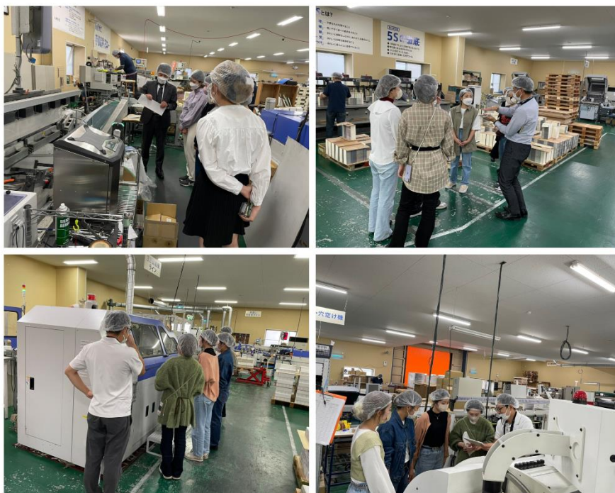
▲2022年CF日記制作プロジェクト：2021年10月6日に開催された愛知大学生の工場見学風景

本プロジェクトでは工場見学を実践的な学びの場として捉えています。教科書や講義だけでは得られない学びを得る。実際の工場の運営や製造プロセスを見ることで、手帳がどのように作られているのかモノづくりの理解を深めることを目的としています。