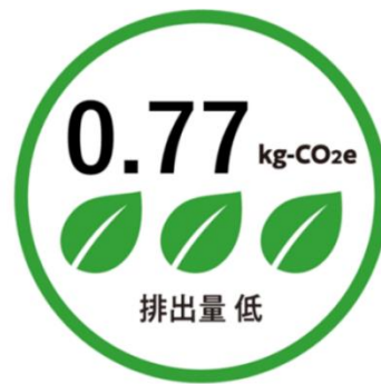
GHG排出量の表示イメージ