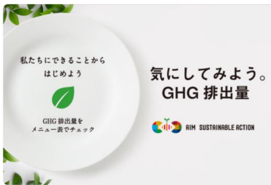
ポスターのイメージ