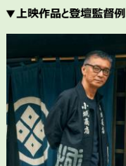
▼上映作品と登壇監督例