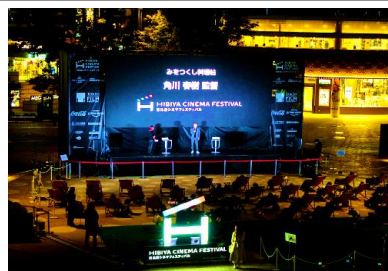
▲過去の開催の様子

【協力】都立日比谷公園/トロント日系文化会館(JCCC)/MomoFilms(予定)