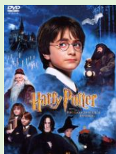
<チャーリーとチョコレート工場><ハリ・ポッターと賢者の石>