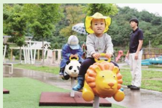
<Park ZONE ~遊びながら~>

映画上映される日比谷ステップ広場では、様々な観覧ゾーンを設置。都心の真ん中で映画を観る6つのスタイルを提案します。また映画上映がない時でもつろぐことができ、仕事の合間やお買い物の合間にも、リラックス時間をお楽しみいただけます。