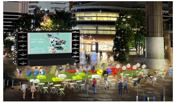
▲ながらゾーン イメージ

2023年の「HIBIYA CINEMA FESTIVAL」のテーマは「ながらシネマ」。静かな映画館や落ち着いた空間で鑑賞する映画の楽しみ方から、作品についてみんなでわいわい“語らいながら”、“食べながら”、リラックスして“寝ころびながら”“揺れながら”、お子様は遊具で“遊びながら”と、6つの「ながらゾーン」で気軽に映画を満喫できる新たな映画体験を提供します。