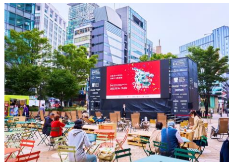
▲昨年の開催の様子

【協 力】株式会社コトブキ／SHORTSHORTS／TOHOシネマズ／都立日比谷公園（予定）