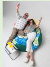
<Relax ZONE ~寝ころびながら~>