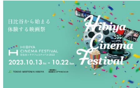
▲メインビジュアル