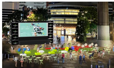
▲ながらゾーンイメージ

6回目を迎える2023年のテーマは「ながらシネマ」。普段は映画館や静かな屋内空間で観ることの多い映画を、家族や友人と“語らいながら”、“食べながら”、“遊びながら”、“寝ころびながら”、思い思いのスタイルで映画を楽しんでいただけるスペースが日比谷ステップ広場に登場します。映画館では味わえない、開放的で五感を刺激しながら楽しむ映画体験をご提供いたします。また、本イベント終了後の10月23日（月）から11月1日（水）までは「第36回 東京国際映画祭」が、日比谷・有楽町・丸の内・銀座エリアで開催されます。映画一色に染まる日比谷の秋をぜひお楽しみください。