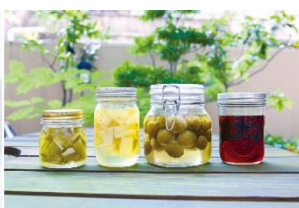
フルーツピネガー