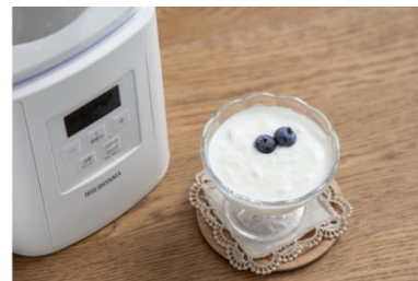
③ヨーグルトの完成！