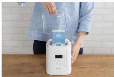
②パックを本体にセット、ふたをして 自動メニューを選択し調理