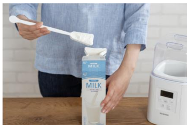
①牛乳/豆乳に種菌となる ヨーグルトを入れ、よく混ぜる