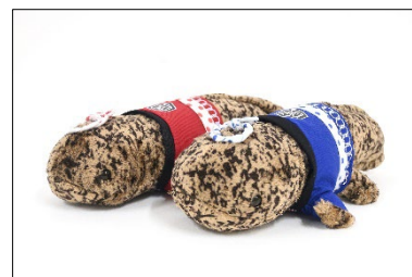
「お祭りオオサンショウウオ」 ぬいぐるみ 青・赤