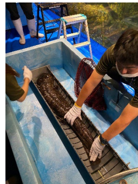
オオサンショウウオ測定の様子 (2022 年撮影)

健康管理のため、年に一度実施する身体測定を間近でご覧いただけます。測定会では、京都水族館で飼育しているオオサンショウウオ約 20 頭のうち、最も大きな個体（交雑個体）の測定を行います。測定の手順をスタッフが解説しながら、日ごろお客さまから多くいただいている質問への回答や飼育スタッフが日頃感じているオオサンショウウオの魅力を解説します。昨年 158cm を記録した最大個体がさらに大きく成長しているのか、体重は変化しているのか、その結果にご期待ください。