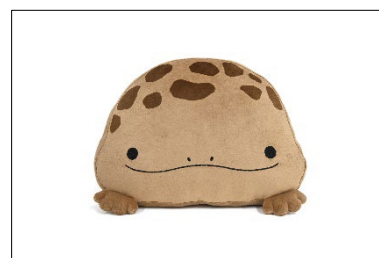
オオサンショウウオクッション