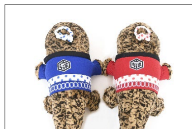
「お祭りオオサンショウウオ」 ぬいぐるみ 青・赤

本イベントは、当館で開館当初から飼育しているオオサンショウウオの生態とその魅力をより多くの方に伝えたいとの思いから、9月9日の「オオサンショウウオの日 ※ 」を地域一体で盛り上げるイベントとして2018年に初開催し、今年で5回目を迎えます。