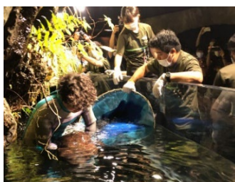
「測って！オオサンショウウオ」 2022年撮影