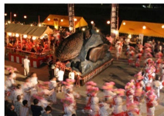
「はんざき祭り」のようす

また、国の特別天然記念物であるオオサンショウウオの保護を行う「はんざきセンター」では、より自然環境に近い状態の飼育環境が整えられ、オオサンショウウオを間近に観察できます。研究の歴史や地域住民との関わりなどの展示があり、湯原の生涯学習、観光の顔として多くの方に親しまれています。