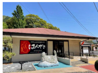
「はんざきセンター」