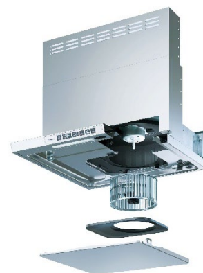
新「LGR シリーズ」展開図

「お掃除が大変」というイメージが根強いレンジフードですが、FUJIOH のレンジフードはお掃除の負担を軽減するべく、定期的にお手入れが必要な「整流板」「オイルガード」「ファン」の 3 つのパーツは着脱しやすい構造です。特に、油汚れが付着しやすい「ファン」には、お掃除が楽になるよう、油を瞬間的にはじく表面処理「ハイパークリーン」を採用。ファンに付着した油を遠心力で分離し、オイルガードに滴下させます。さらに、日常的に使用するスイッチには「抗菌 ※6 」効果のある素材を採用しました。