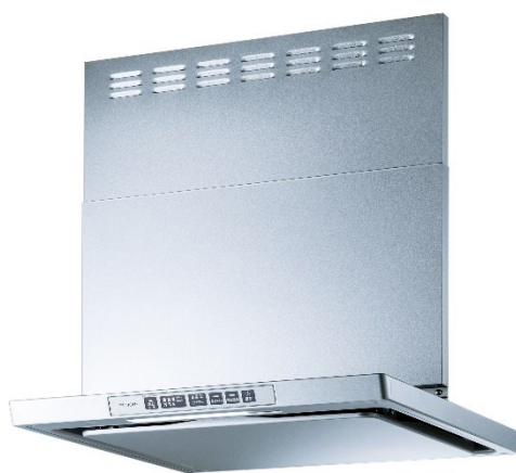
新「LGRシリーズ」イメージ

※1 富士工業グループは、一般家庭用レンジフード供給台数国内シェア No.1。(2021年4月東京商工リサーチ調べ ODM生産品含む) FUJIOHは、富士工業グループの企業ブランドです。