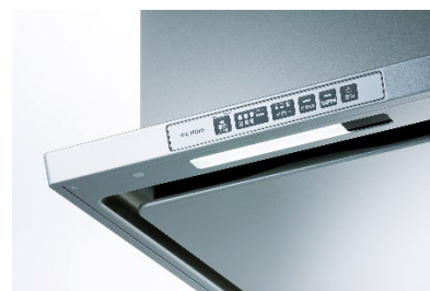
照明調光機能 イメージ

標準で製品に搭載されている LED 照明は、使用環境によってはユーザーが眩しいと感じる場合があります。そこで、本製品では光の明るさを段階的に調整できる調光機能を搭載し、ユーザーの使用環境に合わせて 5 段階の明るさをお選びいただける仕様を採用しました。これにより、ユーザーはご家庭のキッチン環境に最適な明るさで調理をすることができます。