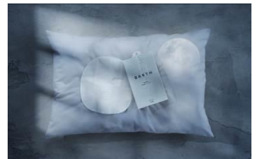
中性重炭酸フェイスマスク