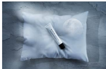
プレミアムアイクリーム