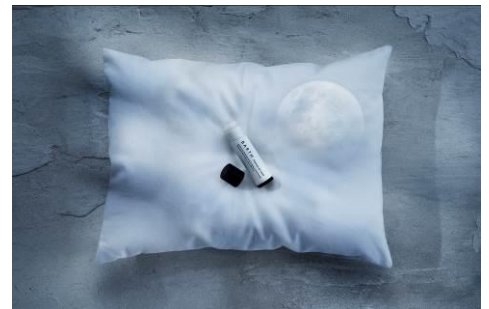
プレミアムリップクリーム