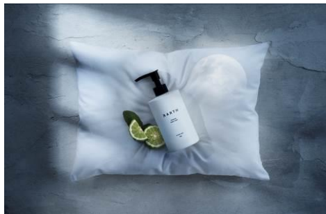
プレミアムボディクリーム at bath time