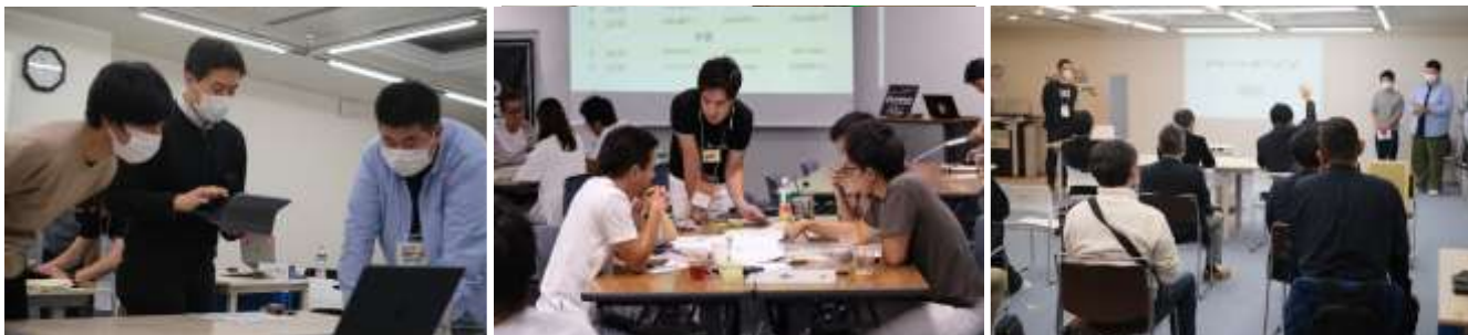
過去に実施した「アトツギ新規事業開発プロジェクト」より