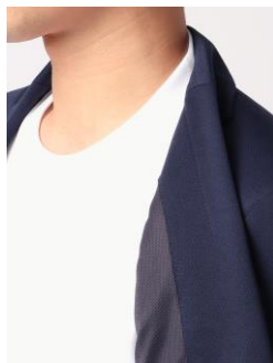
汗ジミを防ぐ襟高設計

「ビズT」は、1枚着でもジャケットを着用した際でも余計なシワが出にくいデザインが特徴です。着用時のシワを軽減するため、アームホールの設計と袖付けをスーツのジャケットと同様の縫製仕様を採用。ジャケットに袖を通した際にもきれいに収まります。また、適度な厚みと張りを持った生地感に加えて、脇からウエストにかけて程よくシェイプしたシルエットがシワを抑えながら、スタイルアップを実現します。さらに、ジャケット着用時への襟裏の汗ジミや汚れを防止する、後ろ襟を高く設定したネックデザインを採用しました。