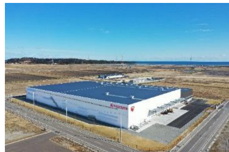
アイリスプロダクト 南相馬工場

生産アイテム：人工芝、建材用平板・波板、脱酸素剤、 パックごはん用トレー、フィルム