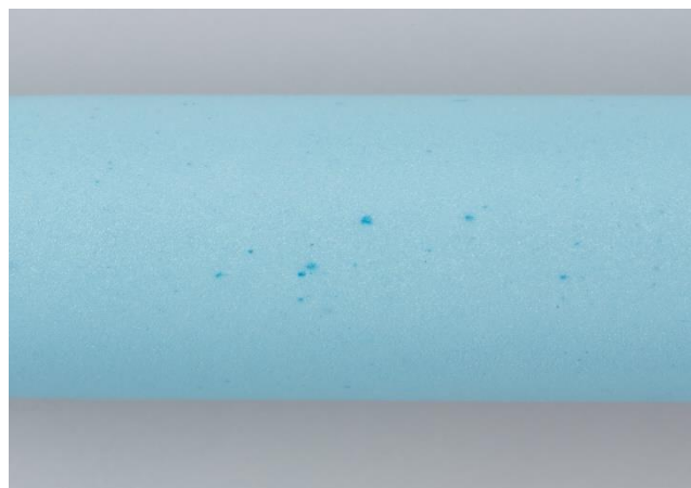
素材を感じられる軸色

本体軸の表面において、中には海洋プラスチックごみの一部が点や模様として表出するものもあり、自然由来の素材が感じられる風合いも特徴となっております。