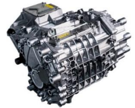
E-Axle 180kW (Gen.2)

「Hyper GT」に搭載される当社の E-Axle 180kW（2023 年 5 月より量産開始）、250kW モデル（2023 年 8 月より量産開始予定）は、第 1 世代（Gen.1）の 150kW モデルをベースに開発された第 2 世代（Gen.2）の新ラインアップです。高占積巻き線適用、新磁石レイアウト適用による出力向上、油冷方式の最適化による冷却効率向上により、小型軽量化と重希土類磁石の大幅削減を達成しました。