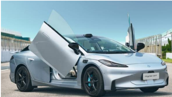
「Aion Hyper GT」