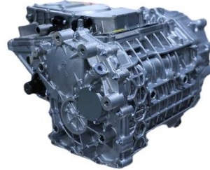
E-Axle 250kW (Gen.2)