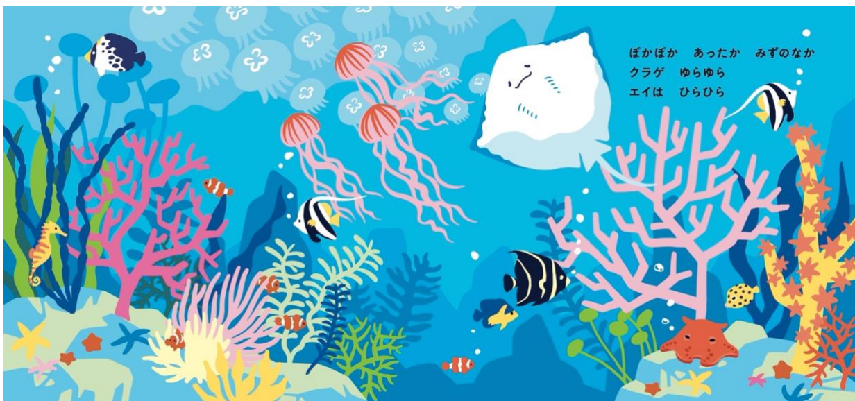
「海のなかまたちとの出会い」のシーン