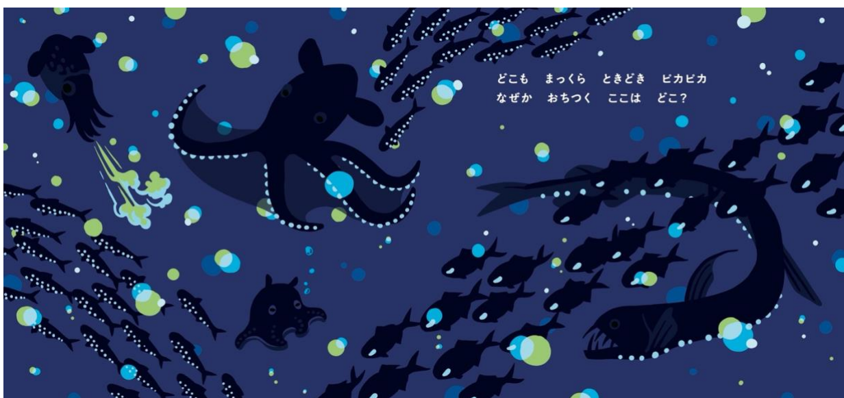
「深海生物たちとの出会い」のシーン