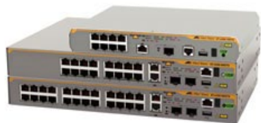
AT-x330-10GTX AT-x330-20GTX AT-x330-28GTX