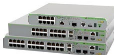
AT-GS970EMX/10 AT-GS970EMX/20 AT-GS970EMX/28