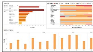
BIツールを用いたデータの可視化