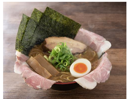
人類みな一風堂 (厚切りバラチャーシュー+低温チャーシュー) 1500円