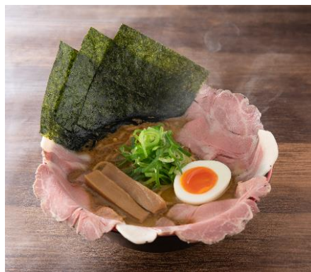
人類みな一風堂 (低温チャーシュー) 1200円