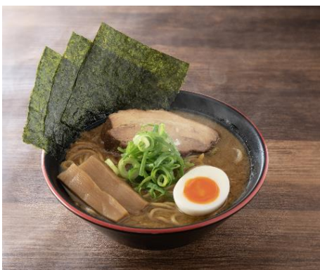
人類みな一風堂 (厚切りバラチャーシュー) 1300円