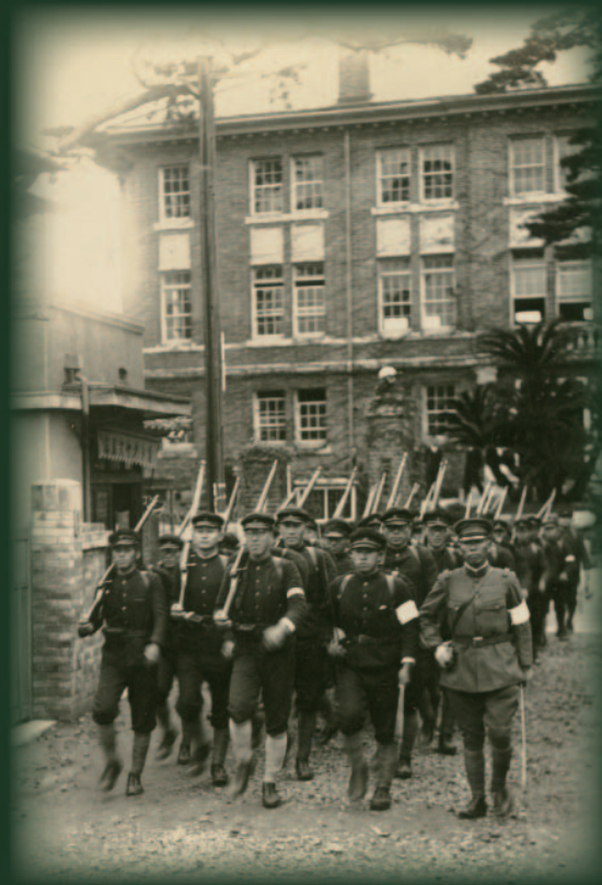
「軍事教練 正門前の行進」1935年