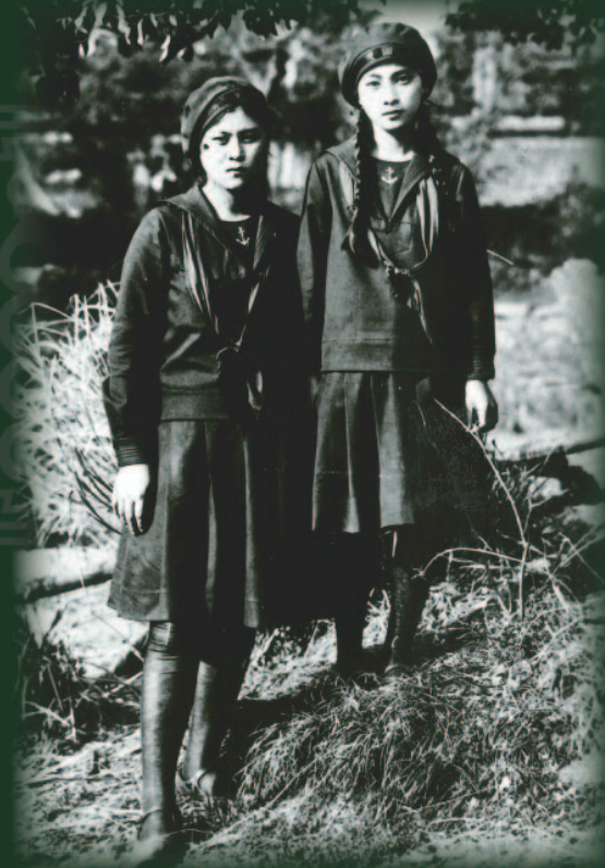
「セーラー服を着た福岡女学校の生徒」 1921年頃