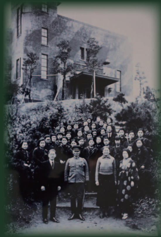
「迷彩が施されたロウ記念講堂」1937年／西南女学院