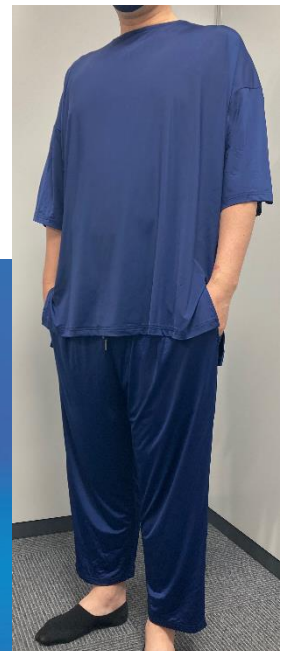
▲冷えとろシリーズの冷感イメージ