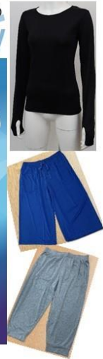
▲着るクーラーシリーズ イメージ