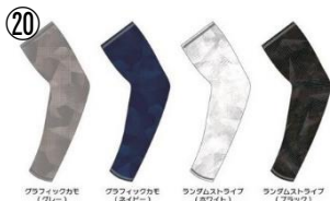
グラフィックカモフラネイビー (グレー) グラフィックカモフラネイビー (ネイビー) ランダムストライプ (ホワイト) ランダムストライプ (ブラック)