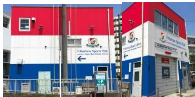
消防団第40分団詰所※イメージ

2023年6月5日（月）から、久里浜駅近接の久里浜駅自転車等駐車場および、横須賀南警察署敷地隣接の消防団第40分団詰所の外壁を横浜F・マリノスのシンボルカラーである赤・白・青のトリコロールカラーに装飾します。自転車等駐車場の総装飾面積は約772㎡、久里浜にお越しになる方々をトリコロールでお迎えします。消防団第40分団詰所は、駅からF・マリノススポーツパークに向かう際の最後の曲がり角に位置しており、F・マリノススポーツパークにお越しになる方々へのガイドの役割も果たします。