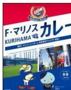
パッケージイメージ