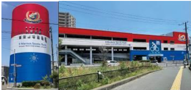
久里浜駅自転車等駐車場※イメージ