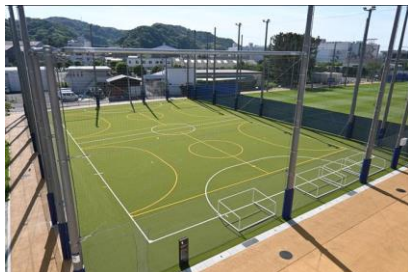
フットサルコート