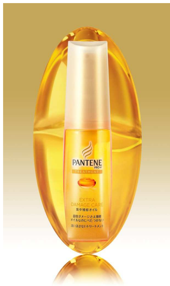
パンテーン エクストラダメージケア 集中補修オイル