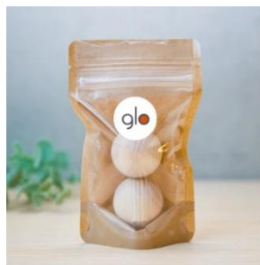
ヒノキ製ストレッチボール