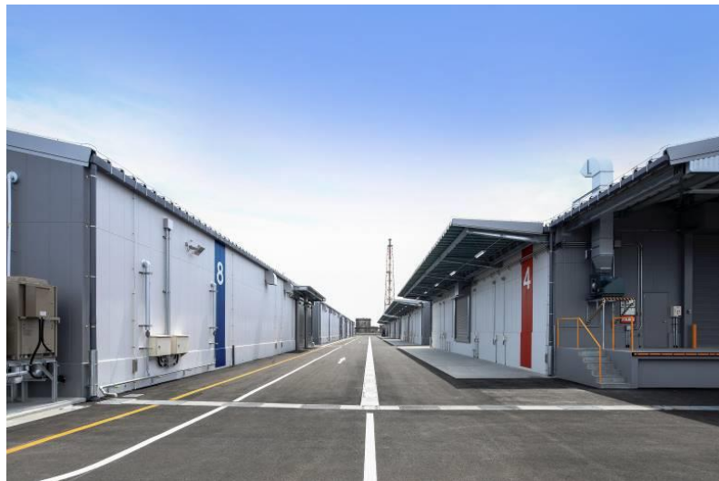
関西ケミカルセンター

名称：山九関西ケミカルセンター 所在地：大阪府高石市高砂2丁目1番地 開設日：2023年5月16日 敷地面積：約27,248㎡ 倉庫面積：8,000㎡（1,000㎡/棟×8棟） 対応危険物：消防法第1類、2類、4類、5類 設備：温度管理倉庫4棟 温度帯2℃～25℃、定温機能 アクセス：大阪港まで高速で約20分 関西国際空港まで高速で約20分 設計：株式会社大建設計 施工：三和建设株式会社 株式会社ダイキンアプライドシステムズ