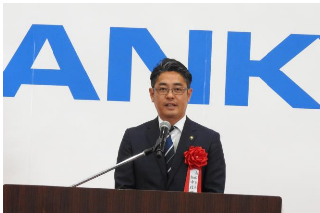
畑中政昭 高石市長