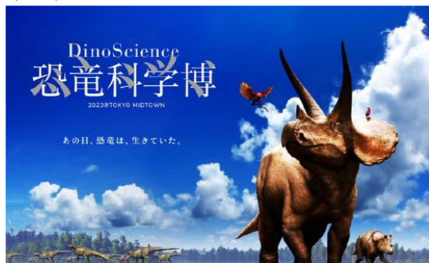
▲『DinoScience 恐竜科学博』イラスト:恐竜くん (C)Masashi Tanaka