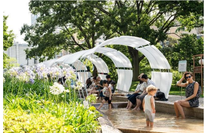
▲過去のイベントの様子