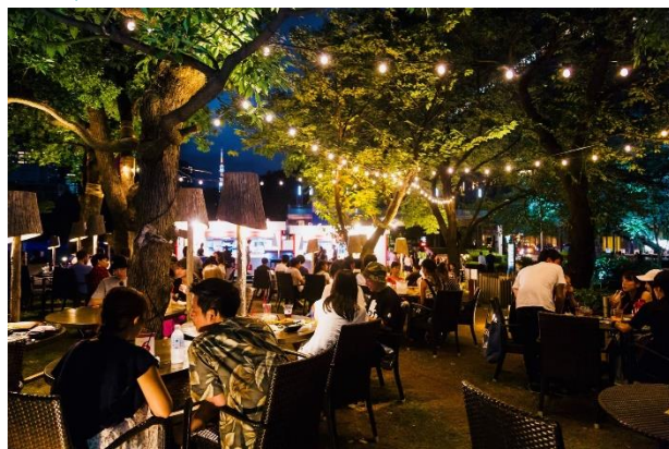
▲過去のイベントの様子

暑い夏に木々がつくり出す木漏れ日を眺めながら涼を感じる期間限定の「MIDPARK LOUNGE」がミッドタウン・ガーデンに登場。暑い夏にぴったりのハーブやスパイスを活かしたメニューや涼やかなメニューなどお楽しみいただけます。緑に包まれ風も心地よい空間で、東京ミッドタウンならではの開放的なラウンジをお届けします。