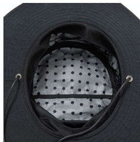
高い遮熱構造 (ココゲル®)