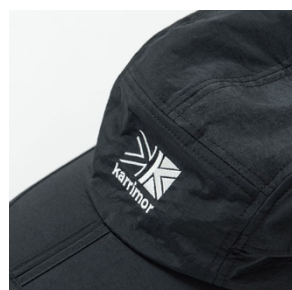
折りたたみ可能つば

日光等の熱線を遮蔽する効果の高いシートを内蔵することで、高い遮熱構造 (ココゲル®) をもたせたキャップ。帽子内部の温度上昇を抑制。真夏の直射日光を再現した実験では、遮熱シートのない帽子に比べて内部の温度を下げる効果がある。紫外線も98%以上カットし (UPF50+)、日焼けを防止。両サイドにはベンチレーションホールを配置し、帽子内部の蒸れを抑えて、頭部のオーバーヒートを効果的に防止。内側頭囲には吸水速乾機能を持ち、抗菌防臭加工 (SEK認証) した汗止めテープを使用。折りたたみ可能つばは折りたたんでポケットにも収納可能。