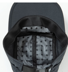
高い遮熱構造 (ココゲル®)