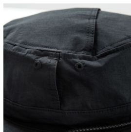
ベンチレーションホール