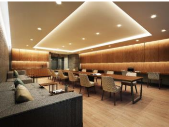
コモンラウンジ（イメージ）