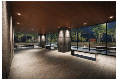
コリドー（イメージ）