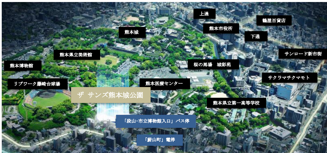
現地航空写真（イメージ）

本物件は、広大な自然と歴史が残る「熊本城旧城域内」唯一の分譲マンションとして誕生します。熊本城周辺は都市景観条例が設けられ、建築物の高さ、形態、色彩の制限などがあるため、城下町の情緒が感じられる美しい街並みが保たれています。また、熊本市電（B系統線）の電停や、熊本都市バスのバス停も至近にあり、市内各所への交通アクセスも良好です。