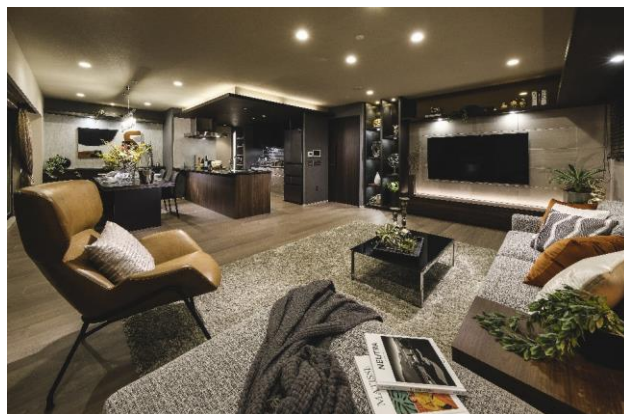
リビング・ダイニング（モデルルーム）

間取りは2LDK～3LDK（60.27㎡～95.81㎡）の14タイプです。基本プランに加えメニュープランも用意し、単身者からDINKS、ファミリーなど多彩なニーズにお応えします。