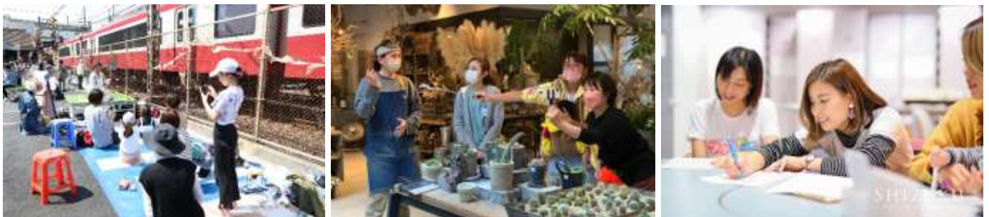
子育て応援ネットワーク活動イメージ

京急グループおよび㈱わたしたちは、今後も「COCOON Project」の拠点などを活用した地域活動やネットワーク強化を通じて、地域の課題に応じた子育て応援を進め、持続的な沿線地域の構築に取り組んでまいります。詳細は別紙のとおりです。