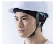
ヘルメットインナーとしてオススメ