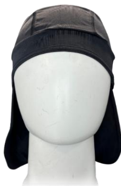
タレがついているので首の後も 涼しく快適に使用できます。