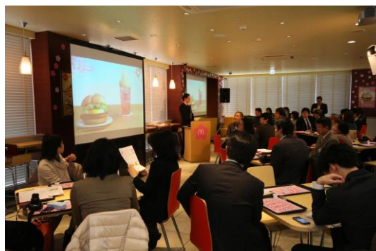
【桜をテーマに装飾したなかで試食】

試食会当日は、約40名の方が、「さくらてりたま」と「マックフィズ さくらチェリー」をご試食。「バンズの桜の香りが春を感じる」「ソースに入った桜大根のシャキシャキ感がアクセントになって楽しい」など、春のメニューにふさわしい、多くのうれしい声をいただきました。