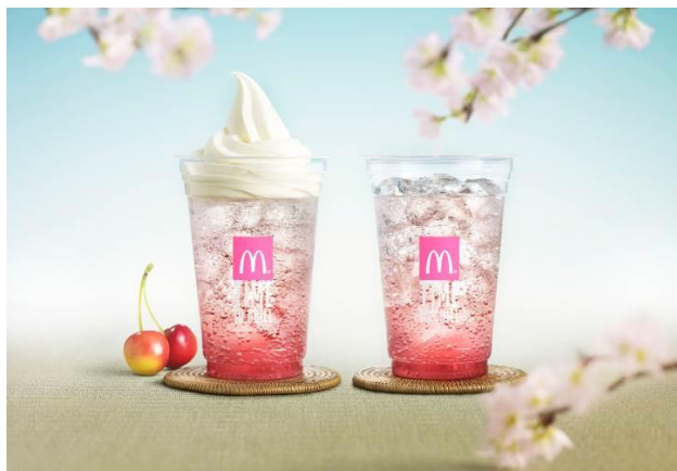
右:「マックフィズ さくらチェリー」 左:「マックフロート さくらチェリー」