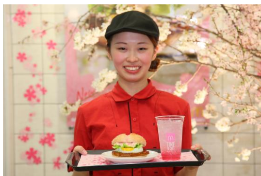
【店内に設置した満開の桜の前でフォトセッション】

「さくらてりたま」は、桜をモチーフにした春色メニューで、しょうが風味のてりやきソースを絡めたポークパティやぶるぶるたまごに、桜がほのかに香るさくら色のバンズ、桜大根入りのマヨソースが新たに出会った、桜満開の春の気分ぴったりのハンバーガーです。