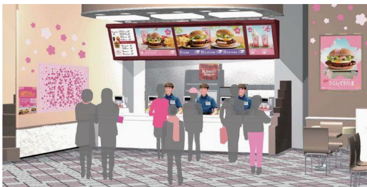
【「マクドナルドさくら DAY」(イメージ)】