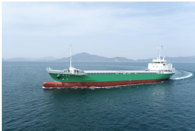
船舶外観イメージ

なお、本船の竣工は2024年春を予定しております。竣工後、災害代行輸送に本船を投入する場合は、JR貨物が各利用運送事業者よりお引き受けした貨物を輸送します。