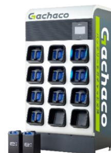
バッテリー交換ステーション