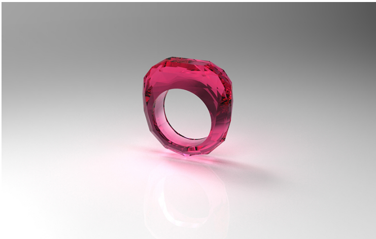
FAB LAB. による試作