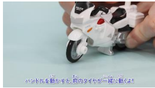
ハンドルを動かすと、前のタイヤが一緒に動くよ！