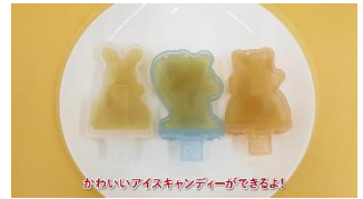
かわいいアイスキャンディーができてよ！