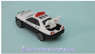
（左側のトミカがまわると右側が回るよ！）

各ハッピーセットの遊び方や仕掛けが分かる紹介動画をマクドナルド公式ホームページやアプリでご紹介します。 【マクドナルド公式ホームページ】 https://www.mcdonalds.co.jp/family/happysset/