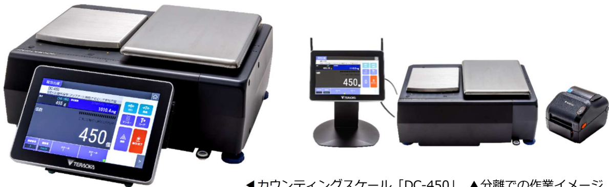
◀カウンティングスケール「DC-450」 ▲分離での作業イメージ