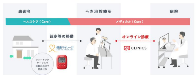
「山形県へき地診療所等におけるオンライン診療モデル事業」の実施イメージ (ヘルスケア型オンライン診療)