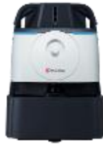
Whiz i アイリスエディション