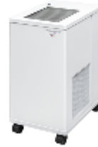
PlasmaGuard PRO™ アイリスエディション置き型