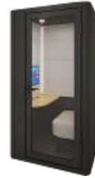
TELECUBE by IRISCHITOSE