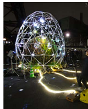
<The Egg of Earth>