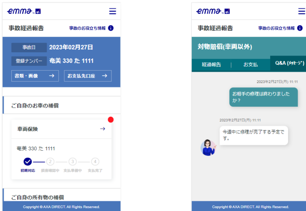
Emma by アクサ 事故経過 WEB 照会画面

なお、事故対応状況の更新通知はこれまでメールやSMSでご連絡しておりましたが、今回、お客さま専用ページ「Emma by アクサ」とLINEのアカウントを連携 ※2 していただくことで、LINEでも通知を受け取ることが可能になりました。 ※3