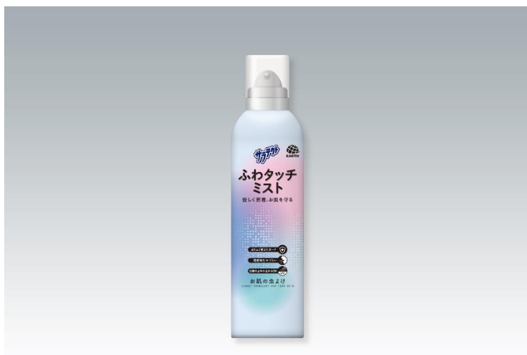
『サラテクト ふわタッチミスト』

アース製薬株式会社（本社：東京都千代田区、社長：川端克宜、以下「アース製薬」）は2月20日（月）に『サラテクト ふわタッチミスト』を全国で発売しました。