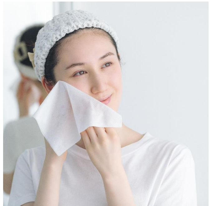
「ネピア 鼻セレブ洗顔専用」