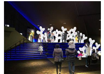
みんなで作ろう！1・2・サンゴ

このワークショップに参加して、サンゴの生態への理解を深め、サンゴ水槽の観察をもっと楽しんでください。 ※SANGO ORIXとは、オリックス不動産が2008年から沖縄の海域でサンゴの移植活動を通して美しい海を次世代へ残すため行っている、サンゴ礁再生プロジェクトです。サンゴ礁の成長状況などの確認調査を含めた保全・再生活動を続け現在までに6,800本のサンゴを移植しました。合計で10,000本の移植を予定しています。