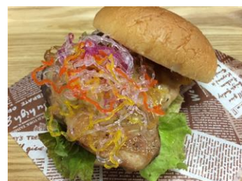
葱塩チキンバーガー

商品名：葱塩チキンバーガー 価格：500円(税込み) 商品説明：サンゴ塩を使った塩だれがアクセントのチキンバーガーです。サンゴ塩はサンゴカルシウムをブレンドした塩です。