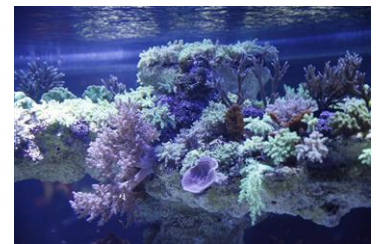
すみだ水族館のサンゴ