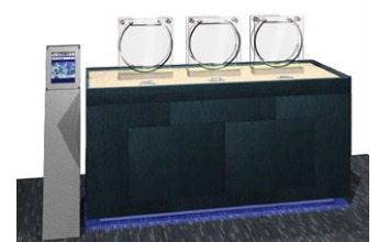
サンゴアカデミー

展示開始日：2014年3月1日(土) 展示場所：6階 光と水のはぐくみ～サンゴ礁 展示生物：シコロサンゴ、クサビライシの仲間 キクメマメスナギンチャク 展示説明：サンゴ砂やサンゴの破片に実際に触れたり、サンゴの体の一部で、イソギンチャクの仲間であるサンゴ虫(ポリプ)を実際に観察することができます。サンゴによって大きさはさまざまですが、多くは1cmにも満たないサンゴ虫(ポリプ)を間近でじっくりとご覧ください。ここで展示するシコロサンゴは、すみだ水族館で大きく育て、サンゴを沖縄の海へ