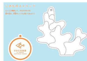
いきものストラップ

タイトル：いきものストラップ 開催期間：①2014年3月10日(月)～3月20日(木) ②2014年4月7日(月)～4月25日(金) 開催時間：10時00分～17時00分 開催場所：5階 アクアアカデミー 開催内容：色鮮やかなサンゴを観察して、自分の好きな色を塗ってオリジナルのストラップを作ってみよう。